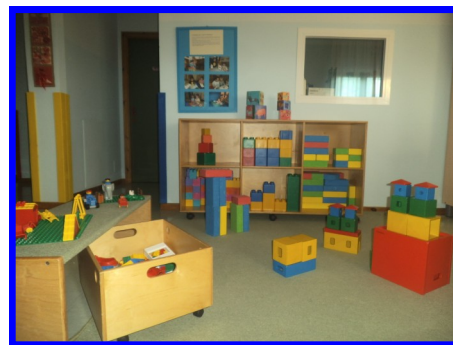
Spazio costruzioni 2° gruppo