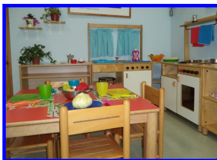
Spazio gioco simbolico 3° gruppo

...un luogo di vita e uno spazio sia "fisico" che "mentale" che accoglie i bisogni dei bambini.