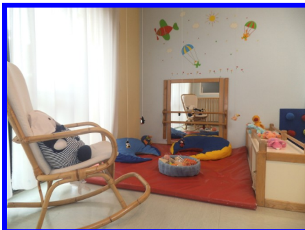
Spazio morbido 1° gruppo